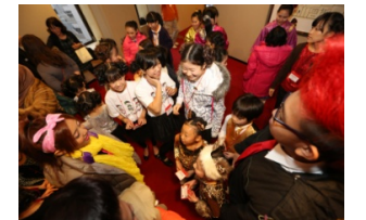
コンサート当日の出演者交流会

2011年に続き、2013年の『チャイルド・エイド・アジア』では、シンガポールから30人、マレーシアから1人が来日、約120人の子どもたちが一つの舞台を創り上げました。国内では福島の子供たち16名が参加、舞台裏では初めて出逢う子どもたちの間に自然な交流が生まれました。そこには言葉は必要なく、笑顔と音楽が共通言語になっていました。